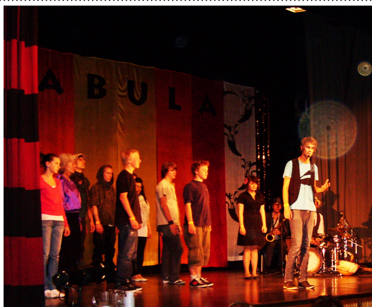
Hela det första berättarläget på scen på Fabula Storytelling Festival 2008, med flera hundra i publiken.