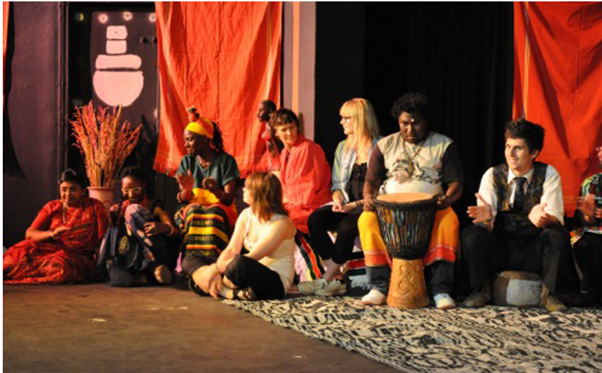
Berättare från Ung Berättarscen på scen på berättarfestivalen Sigana i Nairobi, Kenya juni 2010.

Till sist: Har Ung Berättarscen varit nyskapande? Renässansen för storytelling i västvärlden är nu ca 25-30 år gammal. Ändå är företeelsen fortfarande sällsynt och många känner inte till den. En satsning på muntligt berättande, både som konstart och pedagogiskt verktyg, av den omfattning, bredd och målmedvetenhet som Ung Berättarscen visar, har inte gjorts tidigare.