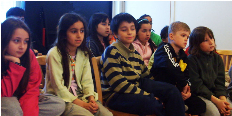
Lyssnare till en av de ungas berättarföreläsningar på Söderholmsskolan i Skärholmen 2007.